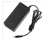
Bloc chargeur 230 V + câble secteur