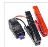
Câble de démarrage intelligent