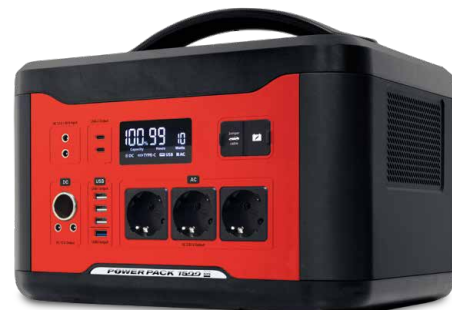
Indicateurs de charge